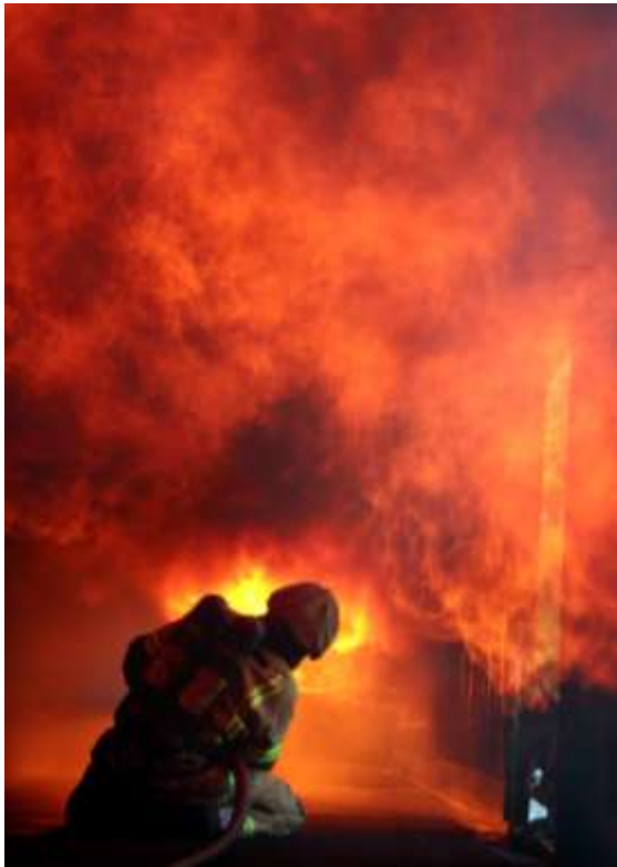
Overtenning når brannmannen ankommer.