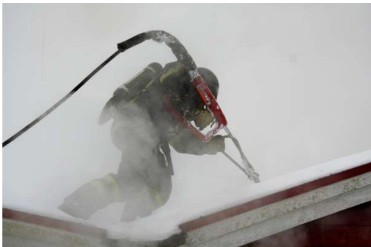
Inn fra taket for å få kontroll på flammer og røykutviklingen. Dette er hardt og krevende fysisk arbeid.